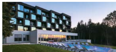
Hotel FRITZ LAUTERBAD – moderner Style und kuschelige Zimmer

THE URBAN BLACK FOREST ist eine Vision, die sich durch das gesamte FRITZ LAUTERBAD zieht. Die Lobby lädt mit ihren Herbstfarben und kuschligen Sofas von Rolf Benz zum Relaxen ein.