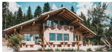
BERGHÜTTE LAUTERBAD – Event- und Wanderlocation

Die Event- und Wanderlocation direkt am Stockinger-Skihang ist Ziel von Waldkletterern aber auch Eventlocation für Hochzeiten, Firmenfeiern und Privatveranstaltungen.