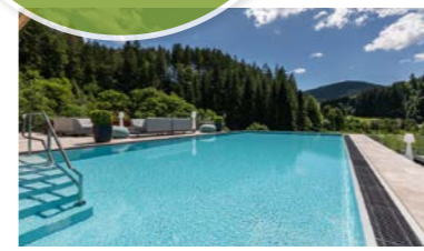
Infinity Pool mit Blick ins Grüne

Golf, Genuss und Wellness in perfekter Symbiose Seit über 90 Jahren ist das Hotel Sackmann von familiärer Herzlichkeit geprägt. Erst 2020 wurde das Hotel fortschrittlich und verantwortungsbewusst modernisiert.